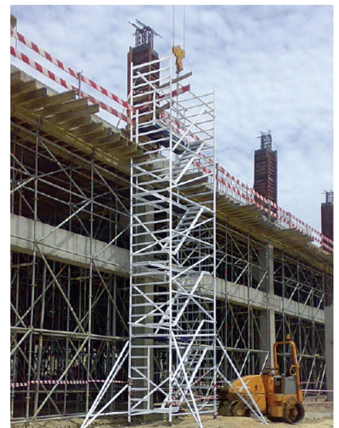
Apoio na construção de edifícios (com amarração)