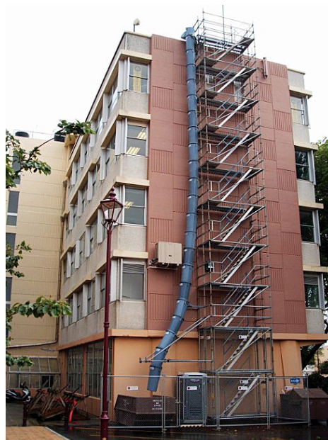
Torres de Acesso